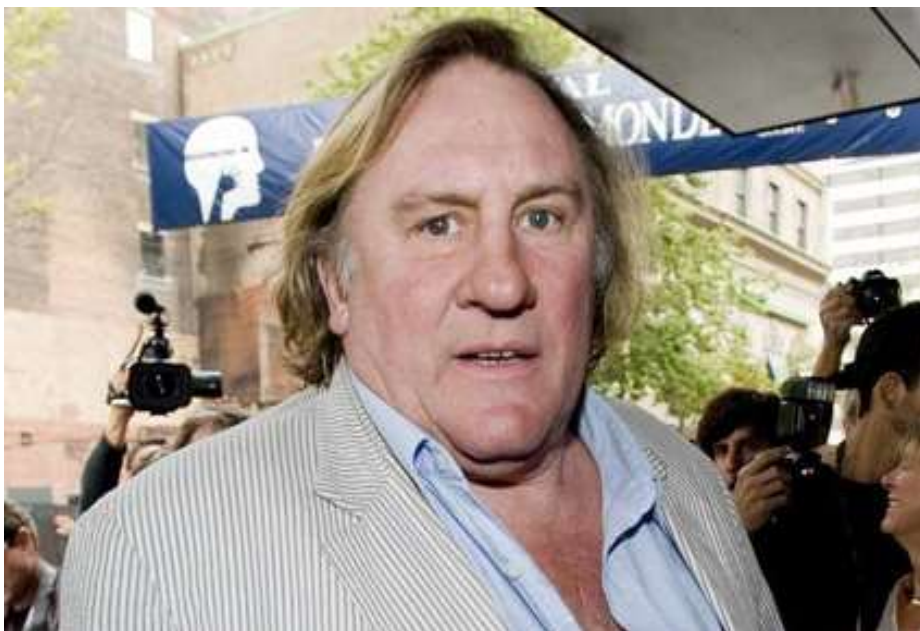
Známy francouzský herec Gerárd Depardieu natáčel v Chotěšově.

Málokdy se stane, aby se chotěšovský klášter stal středem pozornosti tuzemských médií. Po dlouhé době se to ale stalo a zásluhu na tom má známý francouzský herec Gerárd Depardieu, který v Chotěšově na počátku března natáčel část filmu s názvem „Muž, který se směje“. V klášteře během týdne vyrostly kotelna a realistická mučirna jako filmové kulisy. Film Muž, který se směje se natáčí na motivy románu Viktora Huga, jehož děj se odehrává na přelomu 17. a 18. století a je situován do prostředí staré Anglie. Hlavním hrdinou je dvanáctiletý chlapec jménem Gwynplain, kterému král nechal zmrzačit obličej do tvaru věč-