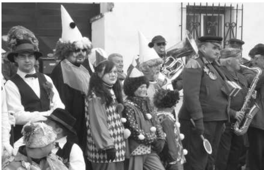
Masopustní průvod obcí právě dorazil k mantovské kapliče

V sobotu 5. března ovládly naši obec maškary. Stejně jako každý rok se také letos děti a dospělí přestrojili do nejrůznějších veselých masek a vyrazili společně směrem k mantovské kapli. Odtud se potom doslova roztančili do všech koutů obce, aby pobavili samy sebe i své spoluobčany. „Je skvělé, že se v Chotěšově tato krásná tradice stále drží. Dává nám tak příležitost si připomenout staré časy našich